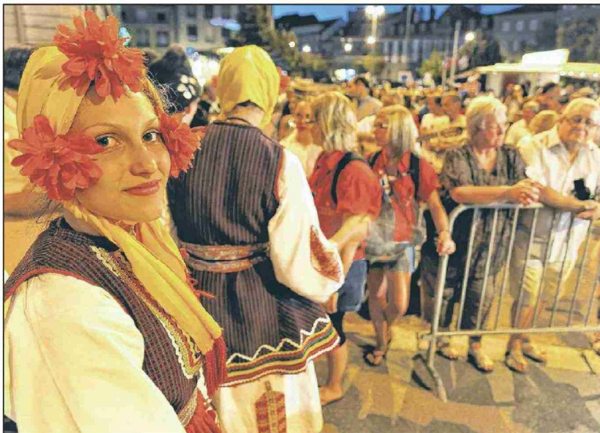
Cette année, les soirées hautes en couleur des RFI n'auront pas lieu à la place Georges-Python.