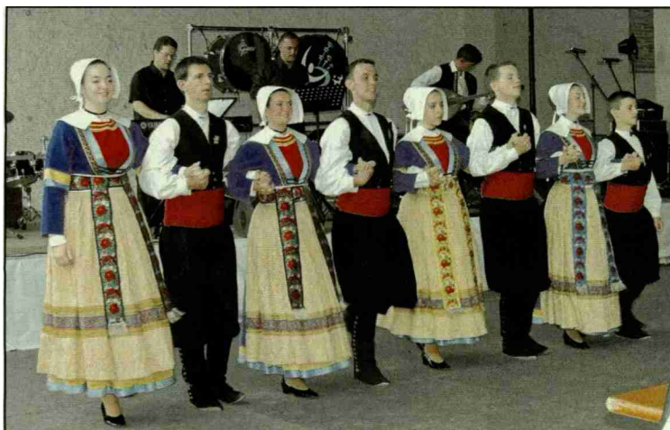
Le groupe Bleuniadur: grâce, précision et poésie