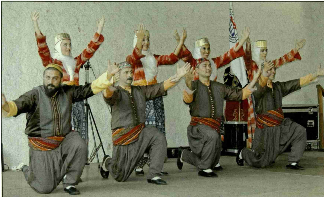
Le groupe Hayfem: amour, joie, respect et... fierté

Présents au Festival des Rencontres de Folklore Internationales de Fribourg, les groupes Hayfem (Turquie), Bagad Landi et Bleuniadur (Bretagne) ont fait voyager le public moudonnois.