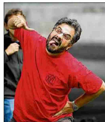
Ils étaient une quarantaine à pratiquer le Haka sur la pelouse de la cour d'honneur du Collège Saint-Michel mercredi soir.