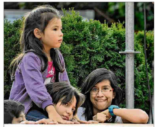
Les groupes chiliens et uruguayens ont mis le feu à la place Georges-Python jeudi soir. Pour le plus grand plaisir du public.